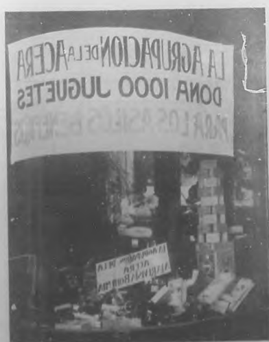
Fotografía de la vitrina de la sombrerería "Iglatera" que durante algunos días se exhibieron los juguetes que la Agrupación de Jóvenes de la Acera del Louvre ha contribuido á nuestro festival del día primero de año en el Malecón.

Mucho éxito y pronto restablecimiento deseamos al querido amigo.